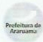
Quadro das Dotações por Órgãos do Governo e da Administração