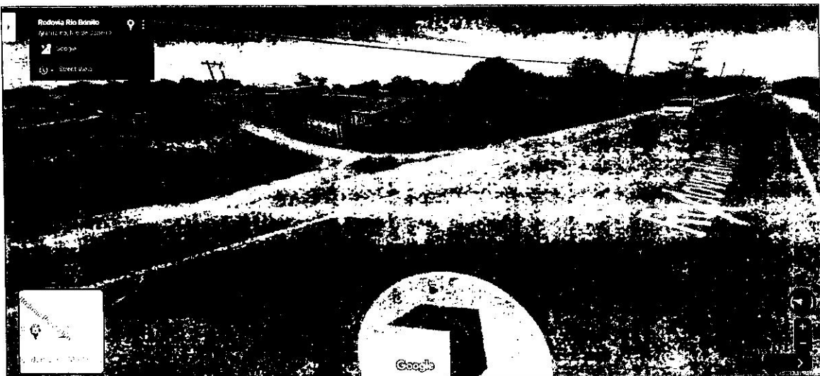
“Araruama, Capital do Windsurf”.