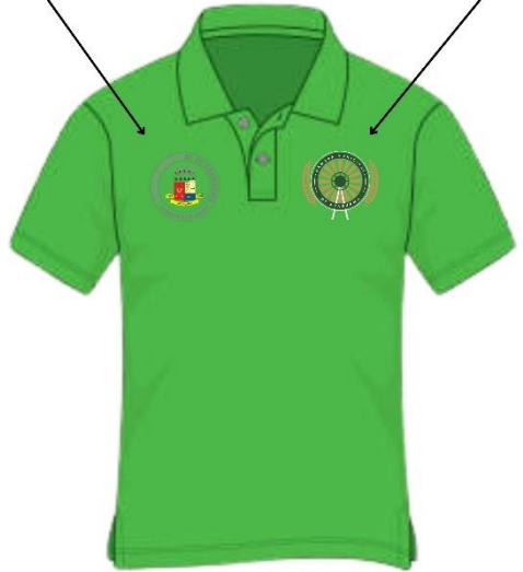
Camisa da Recepção Imagem Ilustrativa - Frente