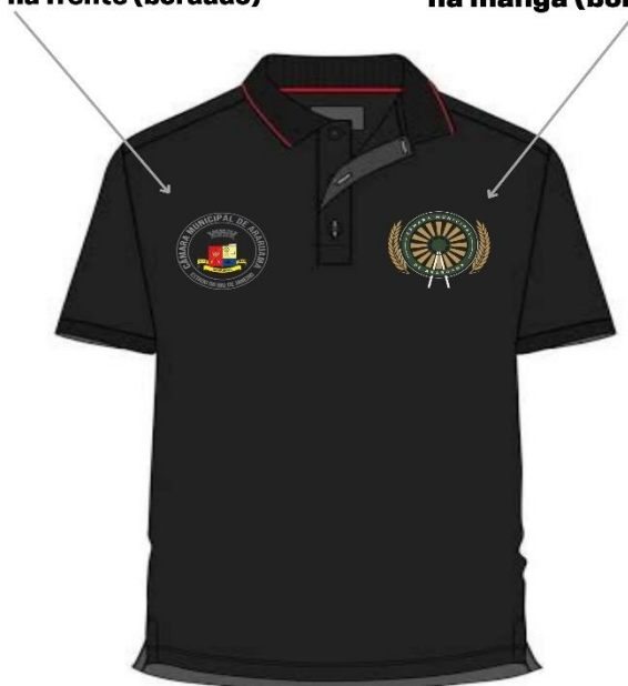
Camisa Masculina Limpeza Imagem Ilustrativa