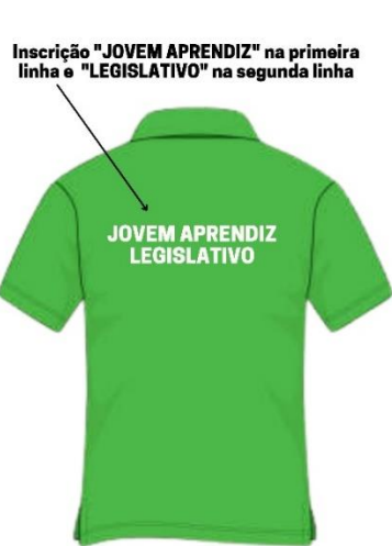
Camisa com Inscrição Jovem Aprendiz Imagem Ilustrativa - Verso