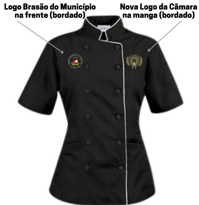
Dólmã Feminina da Copa/Plenário Imagem Ilustrativa

ITEM 5 – Dólmãs de manga curta femininos para Copa/Plenário.