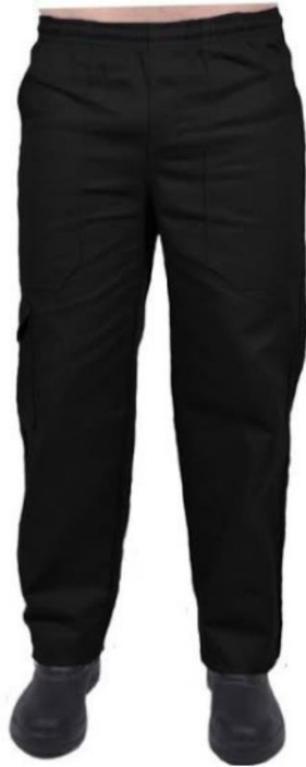
Calça Masculina Limpeza Imagem Ilustrativa

Item 11 - Camisas Gola Polo unissex para Recepção