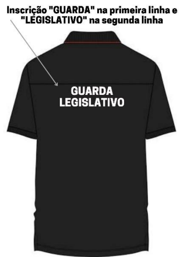
Camisa Inscrição Guarda Legislativo Imagem Ilustrativa - Verso