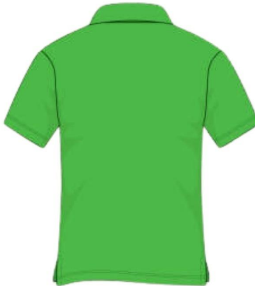
Camisa da Recepção Imagem Ilustrativa - Verso