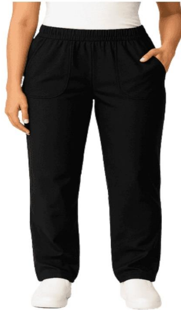
Calça Feminina da Copa/Plenário Imagem ilustrativa