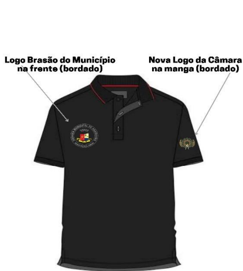
Camisa Guarda Legislativo Imagem Ilustrativa - Frente