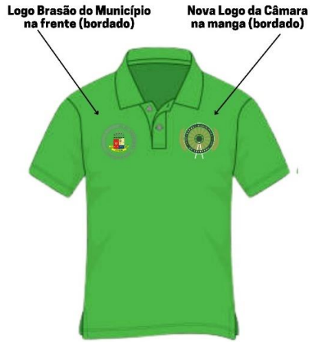
Camisa Jovem Aprendiz Imagem Ilustrativa - Frente