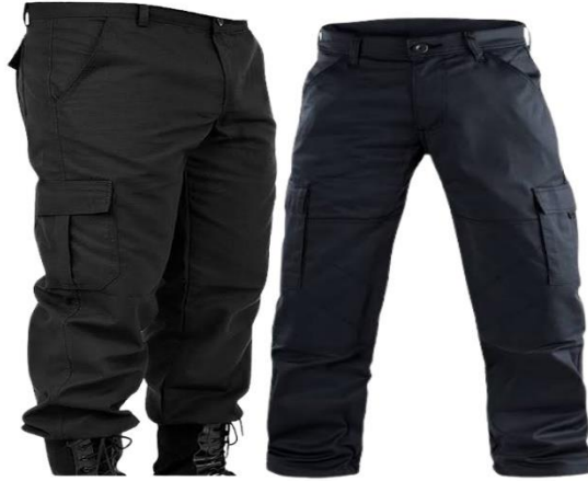
Calça Guarda Legislativo Imagem Ilustrativa